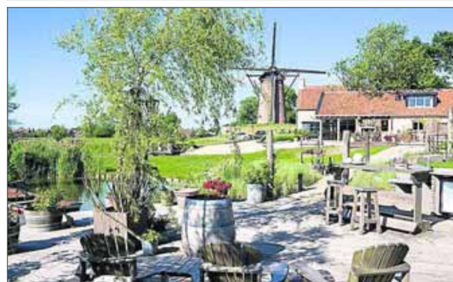
■ In de zomer is het mediterrane genieten op de verschillende terrassen en bij het zwembad met uitzicht op de kreek.

Ook voor de oude mestput moest een bestemming worden gevonden. Dat is nu een verwarmd zwembad geworden. Tine is een beetje haar roeping misgelopen volgens ons. Met veel gevoel voor kleur en inrichting zijn er ware paleisjes ontstaan. „Ach, ik was als kind al bezig met tekenen en schilderen, het zit er