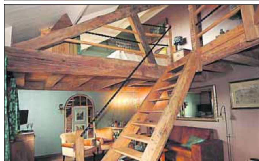
■ In de Brugse kamer heeft de timmerman van oude houten delen een prachtige opgang gemaakt.