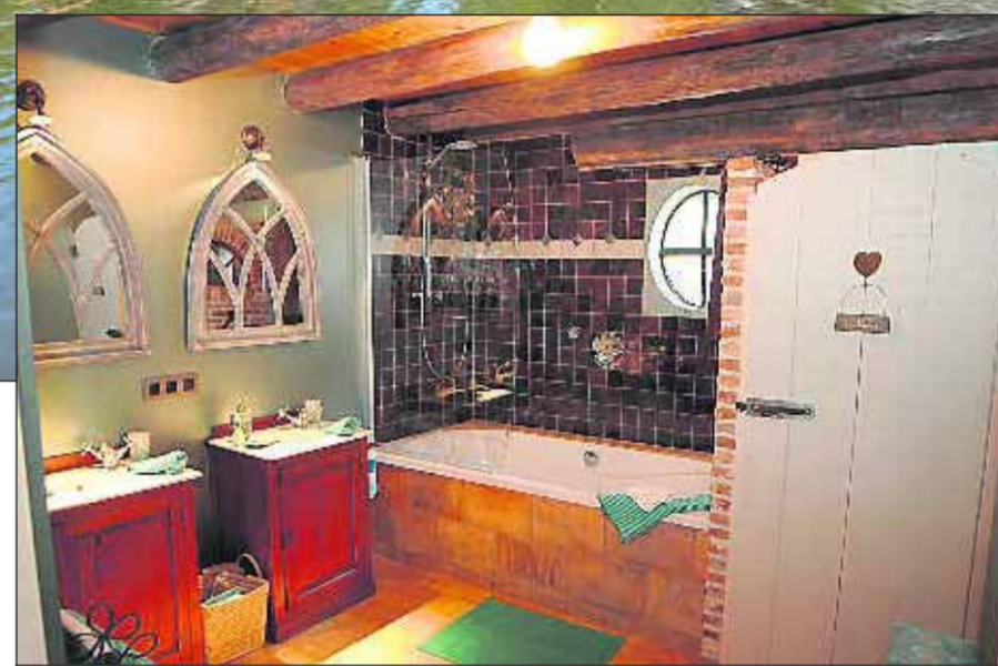
■ Een van de badkamers in de voormalige koeienstal, die door Tine is ingericht met materiaal dat overal vandaan is gehaald.