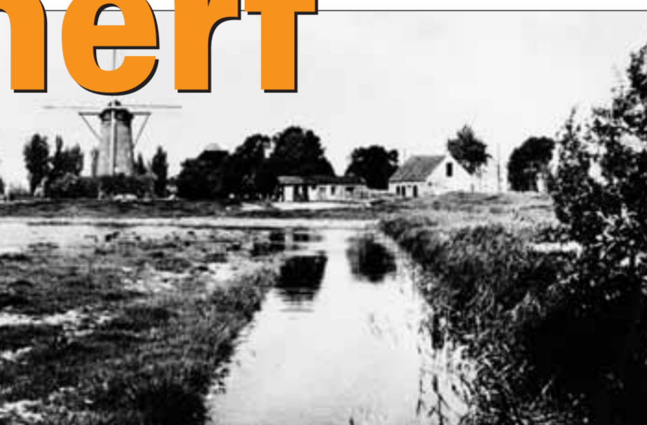
■ Overzicht van het molenerf anno nu. Links een foto uit de oude doos uit de tijd dat de molen nog in gebruik was.

De houten molen uit 1654 heeft in 1884 plaatsgemaakt voor een stenen een stukje verderop, die tot 1963 in ge-